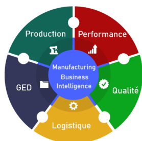
Etendue fonctionnelle du logiciel MES Qubes