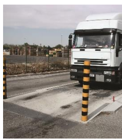
Pont bascule Precia Molen