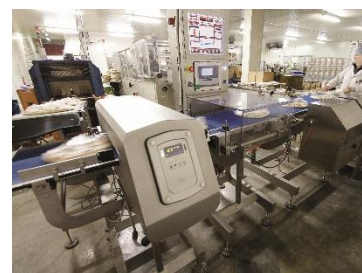
Solution de pesage pour l'industrie (matérielle et logicielle)