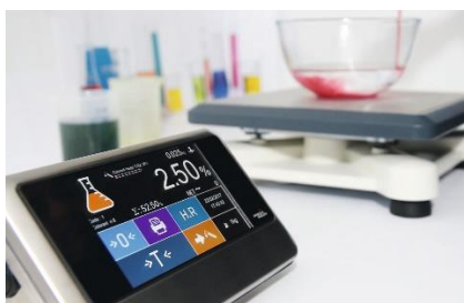
Solution pour la formulation sur terminaux tactiles